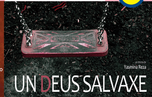
un texto de Yasmina Reza