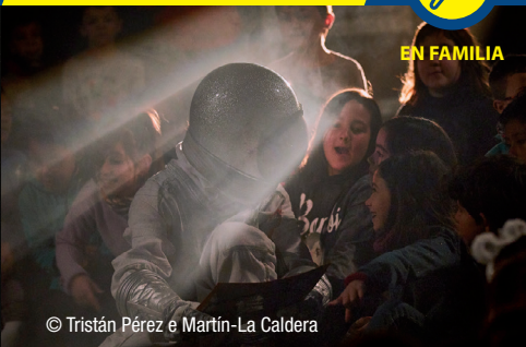
© Tristán Pérez e Martín-La Caldera